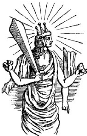
slika br. 8

U skladu sa ovim, u Sanchuniathon-u čitamo da je "Astarte na svoju glavu stavila glavu bika kao simbol pripadanja plemstvu". Međutim, pojavila se druga viša ideja, i izraz te ideje je viđen u simbolu tri roga. Taj ukras za glavu se vremenom doveo u vezu sa kraljevskim rogovima. U Asiriji je kruna sa tri roga bila jedan od "svetih simbola" koji predstavljaju moć koja je božanskog porekla – tri roga su očigledno označavala moć trojstva. Ipak, postoje indicije da je traka sa rogovima, bez kape, u antičko vreme bila korona ili kraljevska kruna. Kruna koju nosi hinduistički bog Višnu, u svom obličju ribe, je samo otvoreni krug ili traka na kojoj se nalaze tri roga, sa kuglicom na vrhu svakog roga (slika br. 8). Sva obličja su predstavljena sa krunama koje su izgleda oblikovane poput ove, i sastoje se od osnove sa tri šiljka, u kojima Sir William Jones prepoznaje etiopljansku ili partansku krunu. Otvorena tiara Agni, hinduističkog boga vatre, na svom donjem delu sadrži dva roga, koji su načinjeni na isti način