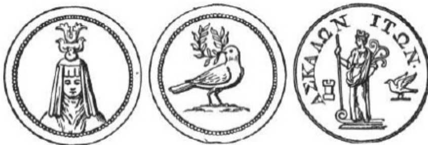
slika br. 21: golub i maslina asirskog Junoa

Verovalo se da u njoj, kao i u Tibernaklu ili Hramu Božijem, ne obitava samo sva moć već i sva dobrota i milost. Smatralo se da svaka osobina koja ima značenje nežnosti i milosti nalazi u njoj, a kada je smrt okončala njenu karijeru, dok je opevana kao neki ko je proglašen božanstvom i dobio oblik goluba, 94 kako bi se izrazila nebeska benignost njene prirode, ona je nazvana imenom „D’Iune“ 95 ili „Golubica“ ili bez člana „Junona“ – ime rimske „kraljice raja,“ što nosi isto značenje. U obličju golubice kao i u sopstvenom obličju, ona je bila obožavana od strane stanovnika Vavilona.