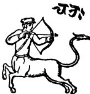
slika br. 12

Grci sami priznaju ovu starost i preuzimanje Kentaura, jer se Ixion često predstavlja kao otac Kentaura, i takođe priznaju da su prvi Kentauri bili isto što i Kronos, ili Saturn, otac bogova. 45