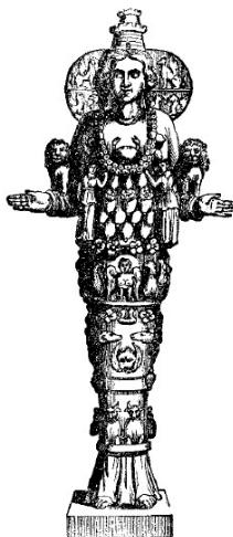
slika br. 4

Kada se, dakle, setimo da je Rhea ili Cybele, boginja tornjeva, zapravo vavilonska boginja, i da da je Semirais kada je obožena, obožavana pod imenom Rhea, tada, po mom mišljenju ne postoji sumnja o ličnom identitetu "boginje utvrđenja".