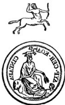
slika br. 11