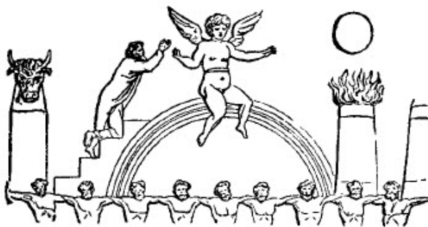
slika br. 19: Baal-Berith, gospod saveza

Saveza (slika br. 19) – Sudijama 8:33. U ovom obličju on je predstavljen na persijskim spomenicima kako sedi na dugi, dobro poznatom simbolu saveza. U Indiji, pod imenom Višnu, Čuvar ili Spasitelj ljudi, iako je bio bog, on je obožavan kao veliki „Čovek-žrtva” koji je ponudio sebe kao žrtvu još i pre postanka sveta. Hindu sveti spisi nas uče da ova misteriozna ponuda pre stvaranja predstavlja osnovu svih žrtava koje su ikada bile ponuđene. 78