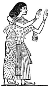
slika br. 14