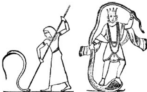
slika br. 18

šire, Ispod njega se javlja zmajeva strašna glava, A njegovo desno stopalo nepomično stoji, Fiksirano na povijenoj kresti čudovišta.”