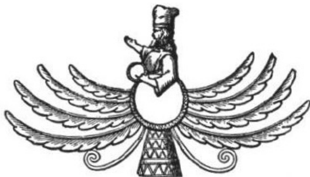
slika br. 23

Ukoliko čitalac kod Lajarda obrati pažnju na tročlani emblem vrhovnog asirskog božanstva, on će videti da je sama ova ideja vidljivo otelotvorena. Tu su krila i rep golubice povezana kanapima a ne noge (Layard Niniva i njeni ostaci, vol. ii. p. 418; vidite prateće duboreze (slika 23), Bryant, vol. ii. p. 216; Kitto Bib. Cyclop., vol. i. str. 425).