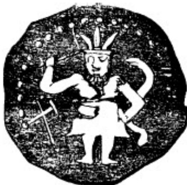
slika br. 9

kao i asirski, pokazujući antička verovanja i to odakle potiču. Umesto tri roga, listovi sa tri roga su uvedeni kao zamena (slika br. 9); i tako je traka sa rogovima postepeno prerasla u savremenu krunu sa tri lista, ili druge poznate trolisne ukrase.