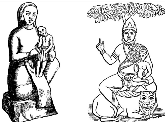
slika br. 2

Shing Moo i Ma Tsoopo iz Kine Ime Shing Moo, koje kinezi daju njihovoj "svetoj Majci" kada se uporedi sa drugim imenom za istu boginju u drugoj provinciji u Kini jasno ukazuje na zaključak da je Shing Moo samo sinonim za jedno od dobro poznatih imena boginje-majke iz Vavilona. Gillespie (u Land of Sinim ) izjavljuje da kinesku boginju-majku, ili "Kraljica Neba", u provinciji Fuh-kien, obožavaju moreplovci pod imenom Ma Tsoopo. Sada, "Ama Tzupah" označava "Zagledanu Majku"; i postoji dosta razloga za verovanje da Shing Moo znači isto to; Mu je jedan od oblika u kojem se Mut ili Maut, ime za veliku majku, pojavljuju u Egiptu (Bunsens's Vocabulary); a Shngh na vavilonskom označava "pogled". Egipatska Mu ili Maut se predstavlja kragujem, ili okom oko koga se nalaze kragujeva krila (Wilkinson). Simboličko značenje kraguja se može shvatiti iz izraza iz Svetog pisma: "Te staze ne zna ptica, niti je vide oko kragujevo" (Jov 28:7). Kraguje se ističe svojim ostrim vidom, pa stoga, oko okruženo kragujevim krilima pokazuje da je, iz nekog razloga, velika majka bogova u Egiptu bila poznata po "pogledu". Ali je ideja iz