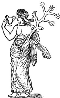
slika br. 17

Postoji još jedan hijeroglif koji u mnogome potvrđuje ovo – grančica bršljena. Ni jedan simbol nije upečatljiviji za obožavanje Bakusa. Gde god su obredi posvećeni bakusu izvođeni, i gde god su se održavale njegove orgije, grančica bršljena se sigurno pojavljivala. Bršljen je, u nekom obliku, od suštinske važnosti za oove obrede. Sldbenici su je nosili u ruci, vezivali je oko glava, ili na sebi oslikavali list bršljena. Koja bi mogla biti svrha i značenje ovoga? Nekoliko reči je dovoljno da se to objasni. Kao prvo, dakle, imamo dokaze da je Kissos, grčka reč za bršljen, bilo jedno od naziva za Bakusa; dalje, da iako je ime Hus, u svom ispravnom obliku, bilo poznato sveštenicima u Misterijama, ipak uobičajeni način na koji se ime njegovih potomaka, Husita, izgovaralo u Grčkoj, nije u skladu sa orijentalnim načinom, već "Kissaioi," ili "Kissioi." Strabo, govoreći o naseljenicima Suse, koji su bili husiti, ili antičke Husove zemlje, kaže: "Stanovnici Suse se nazivaju Kissioi" 53 – odnosno, bez svake sumnje, Husiti.