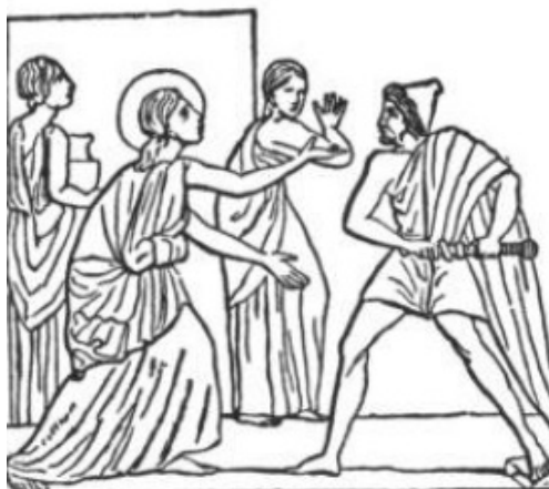
Circe, ćerka sunca (slika br. 22)

Sada, da li iko može da veruje da ovo podudaranje može da bude slučajnost. Naravno, da je Madona do te mere stvarno izgledala kao Devica Marija, to nikada ne bi dozvolili idolopoklonstvo. Ali postalo je očigledno to da je boginja koja je utemeljena u papskoj crkvi zarad vrhunskog obožavanja od strane poklonika iste crkve, sama vavilonska kraljica koja je postavila Nimroda (Nevroda) „Sina” kao rivala Hristu, i koja je sama po sebi inkarnacija svake vrste raskalašnosti, dala mračan karakter rimskom idolopoklonstvu. Šta bi moglo da se iskoristi kako bi se ublažio zlokoban karakter takvog idolopoklonstva da bi se reklo da se dete koje ona iznosi kako bi ga obožavali zove Isus? Kada je bila obožavana sa svojim detetom u Vavilonu, dete je bilo nazvano imenom koje je karakteristično za Hrista i njegov veličanstveni karakter, kao što je to ime Isus. Dato mu je ime „Zoro-ashta“, „seme žene.“ Ali to nije umanjilo gnev Božiji usmeren