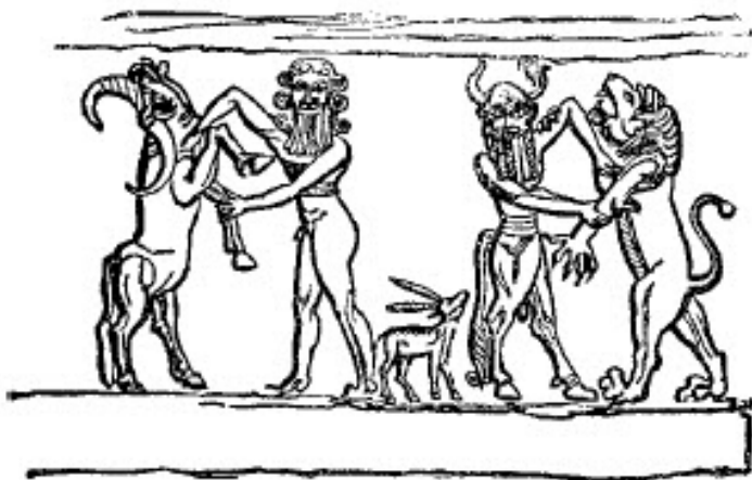
slika br. 6

opisuje poreklo neobičnog simbola, koji se često pojavljuje među skulpturama u Ninivi, gigantskog rogatog čoveka-bika, koji predstavlja velika asirska božanstva. Ista reč koja označava bika, takođe označava i vladara ili princa. 37