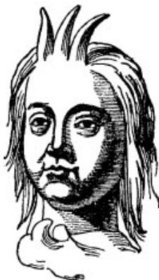
slika br. 5

Dobro je poznato da je Kronos, ili Saturn, Rhein muž; ali manje je poznato ko je sam Kronos. Otkrianjem originala, za to božanstvo je utvrđeno da je prvo kralj Vavilona. Teofil iz Antioha pokazuje da je kronos na istoku obožavan pod imenima Vil i Bal; a od Euzebija saznajemo da su Asirci svog prvog kralja, čije je ime bilo Bel, takođe zvali Kronos. Budući da originalne kopije Euzebija ne prikazuju Bela kao stvarnog kralja Asirije pre Ninusa, kralja vavilonaca, i razlikuju ga od njega, to znači da je Ninus, prvi kralj vavilona, bio Kronos. Ali saznajemo da je Kronos bio kralj Kiklopa, koji su bili njegova braća, i koji su ime dobili po njemu, 35 i da su Kiklopi poznati kao "izumitelji izgradnje tornja".