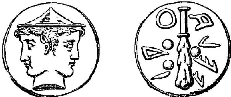
slika br. 3

Onaj koji je izazvao podelu jezika je bio onaj koji je "rastavio" prethodno ujedinjenu zemlju (1. Mojsijeva) "na delove" i "rasuo" delove svuda. Koliko je, dakle, kao simbol, značajan malj, kao spomen na delo Husa, kao Vila, "Posramljenog"? Taj značaj je još očigledniji kada se čitalac okrene hebrejskom jeziku iz 1. Mojsijeve 11:9 i otkrije da je ista reč od koje potiče reč malj je ona koja se upotrebljava kada se kaže da su kao posledica podele jezika čovekova deca "rasuta po svoj zemlji". Reč koja se ovde koristi za rasipanje po zemlji je Hephaitz, koja u grčkom obliku postaje Hephaitz 28 i stoga koren dobro poznatog, ali slabo shvaćenog imena Hefest, koje se primenjuje na Vulkanu, "Oca bogova". 29