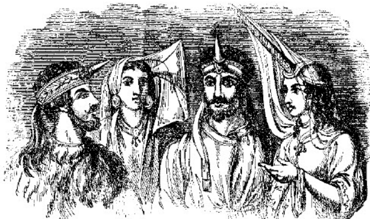
slika br. 7

Zbog ideje moći koju nosi "rog", čak i potčinjeni vladari su izgleda nosili prsten ukrašem jednim rogom, ako simbolom svoje izvedene moći. Bruce, abisinijski putnik, daje primere abisinijskih vladara koji su se ukrašavali na taj način (slika br. 7), on kaže da je rog poseebno privukao njegovu pažnju kada je primetio da upravitelji provincija nose taj ukras na glavi. 38 Što se tiče suverene moći, kraljevska traka za glavu je ponekad bila ukrašena sa dva, a nekada i sa tri roga. Dva roga su očigledno bili prvobitni simbol moći suverea; na egipatskim spomenicima, glave oboženih vladara obično nemaju više od dva roga koji pokazuju njihovu moć. Budući da je Nevrodov suverenitet bio zasnovan na fizičkoj snazi, dva roga bika su bili simboli te fizičke snage.