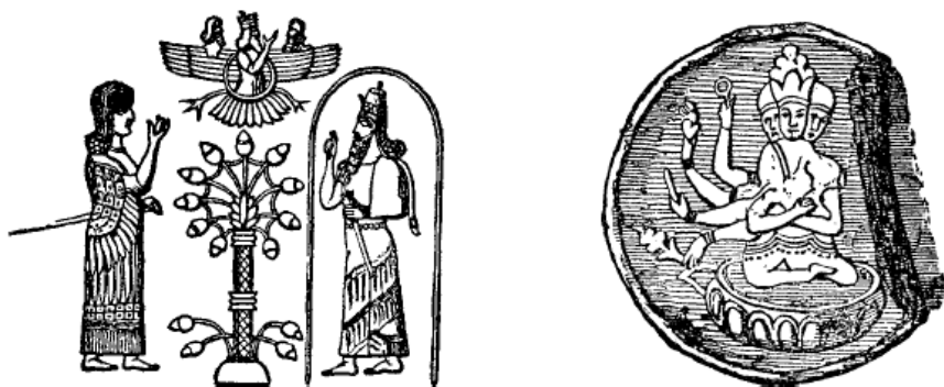
slika br. 1

jednom telu. 4 Vavilonci imaju nešto slično. Mr. Layard, u svom poslednjem radu, daje primer takvog trojnog jedinstva, obožavanog u antičkoj Asiriji (slika br. 1 lijevo). 5 Isečak (slika br. 1 desno) drugog sličnog božanstva, obožavanog među paganima u Sibirum je uzet sa medalje i carskom kabinetu u Sankt Petersburgu, i dato u Parsonovom "Japhet-u." 6