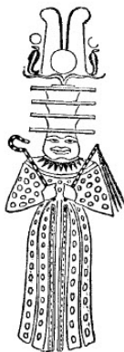
slika br. 13

Ovo ime izgleda da pokazuje da je Nevrod dobio slavu tako što je ukrotio konja kako bi ga čovečanstvo upotrebilo za lov, pa se njegova slava kao lovca uglavnom oslanja na to da je pronašao način da mu leopard pomogne da lovi ostale divlje životinje. U Indiji se posebna vrsta pitomog leoparda i danas koristi za lov, a za Bagajet-a I, imperatora Indije, je zabeleženo da je u svojoj lovačkoj družini imao, ne samo pse različitih rasa, već i leoparde čije su "ogrlice bile ukrašene draguljima". Na reči proroka Habakkuk-a 1:8, "brži od leoparda", Kitto ima sledeće komentare – "Brzina leoparda se nalazi u poslovicama u svim zemljama u kojima živi. Ovo, udruženo sa njegovim ostalim osobinama, je dalo ideju ljudima na istoku da ga mogu delimično dresirati i upotrebiti za lov.. Leopardi se dana retko drže za lov u zapanoj Aziji, osim kod kraljeva i guverera, ali su dosta češći u istočnim delovima Azije. Orosius pominje da je jednog kralj Portugala poslao papi, i koji je izazvao veliko zaprepašćenje lakoćom sa kojom je savladavao i ubijao jelene i divlje veprove. Le Bruyn pominje leoparda koga je držao Paša koji je upravljao Gazom, i drugim filistinskim teritorijama, koga je često koristio a lov na šakale. Ali se upravo u Indiji