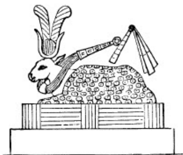
slika br. 15

Krava Athor, međutim, kao žensko božanstvo koje odgovara Apisu, je dobro poznata kao "krava sa pegama", (Wilkinson) i poznato je da su druidi u Brianji takođe obožavali "kravu sa pegama" (Davies's Druids). Koliko god, međutim, bio redak slučaj pronalaženja obožavanog teleta ili mladog bika predstavljenog sa pegama, ipak postoje dokazi da su nekada tako predstavljeni. Prateća figura (slika br. 15) predstavlja to božanstvo, kako je Col. Hamilton Smith kopirao "iz originalne kolekcije koju su napravili francuski umetnici sa Francuskog Instituta u Kairu." Pošto pronalazimo da je Oziris, veliki egipatski bog, u različitim oblicima, bio obučen u leopardovu kožu ili odeću sa pegama, i da je odeća sa dezenom leopardove kože bila nezamenljivi deo svete odežde visokog sveštenika, možemo biti sigurni da taj kostim ima duboko značenje. A koje bi drugo značenje mogao imati, osim da identifikuje Ozirisa sa vavilonskim bogom, koji je slavljen kao "ukrotitelj leoparda", i koji je obožavan čak i kada je bio, kao Ninus, dete u naručju svoje majke?