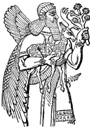
slika br. 16

ili Mouis." Mouis, ili Mouis, na vavilonskom, kao i Nimr, označava "pegavog". Stoga staje lako predstaviti Nevroda simbolom "pagavog jagnjeta", a posebno u Grčkoj i na drugim mestima na kojima je prevladao govor sličan onome u Grčkoj. Ime Nevroda, poznato grcima, je Nebrod. 50 Ime za lane, kao "pegavo", u Grčkoj je Nebros; 51 i ništa nije prirodnije nego da Nebros, "pegavo lane", postane simbol za samog Nebroda. Budući da se Bakus u Grčkoj simbolizuje Nebros-om, ili "pegavim jagnjetom", kao što ćemo pronaći, kako je on skriveno identifikovan sa Nevrodom?